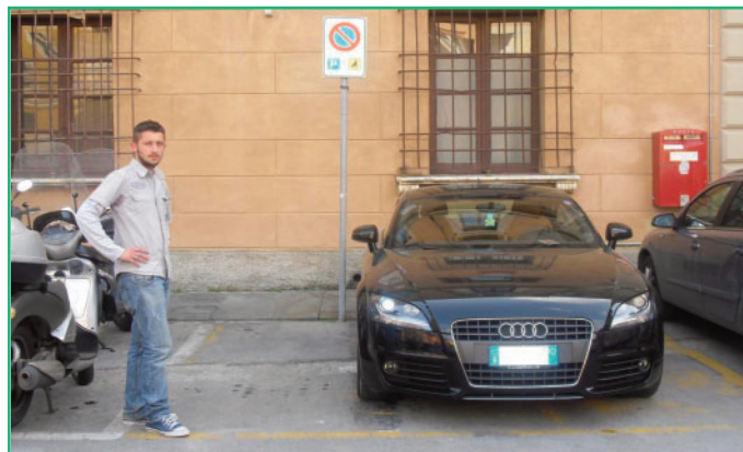
DISAGIO Lo stallo per disabili in piazza Mercurio

DALLE MISURAZIONI FATTE , innanzitutto risulta che, a parte poche eccezioni, non sempre la fascia di trasferimento è presente . Se c'è, le sue dimensioni difficilmente superano il metro di larghezza. Inoltre, il numero di parcheggi per disabili è lar-