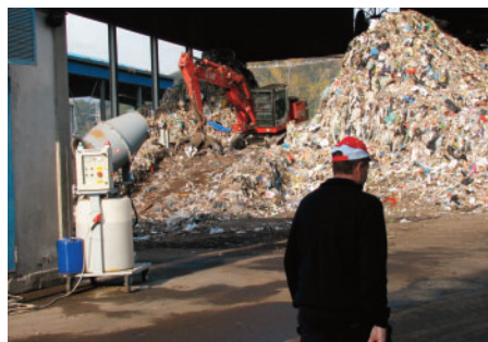
RIFIUTI L'interno del Cermec di Avenza